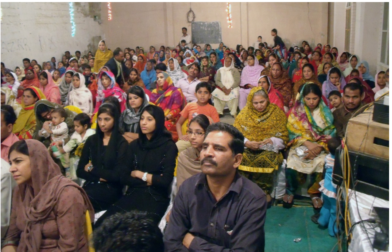
Fénykép Iszlamadabdól, Pakistán, 2010. Február 20.

Ez az Istenellenes ún. szentháromság: a nagy sárkány, az antikrisztus és a hamis próféta, háromszorosan magán hordozza a 666 –os számot. Ehhez pedig még hozzáadódik az is, hogy a 6 –os szám az Istennel való ellenségeskedés száma. Így a háromszoros 6 –os szám (666) csúcspontos megtestesítője az emberi ellenségeskedésnek Istennel szemben. A 6 –os számnak görögül Stigma jelentősége van, ami megkülönböztető jelt jelent. Hogy ez a három ismertető jel éppen a mi (vég) időkben merül fel egymással párhuzamosan és emellett Babilon (lásd a Jelenések 17.fejezetét) aktuálisan ismét Jeruzsálem ellenfeleként lép fel, mindezen összefüggések felfigyelésre kellene ösztönözzenek.